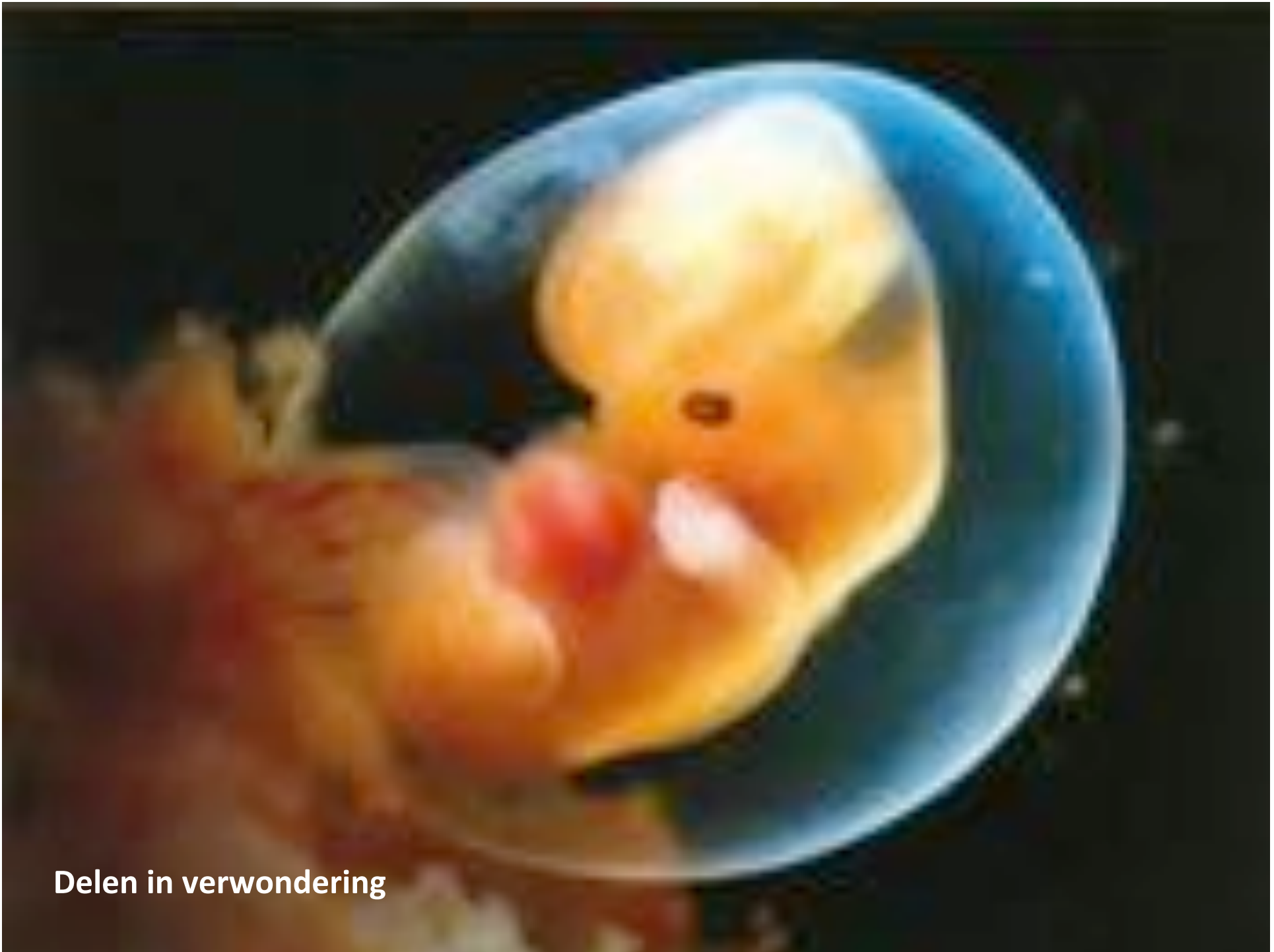
Delen in verwondering